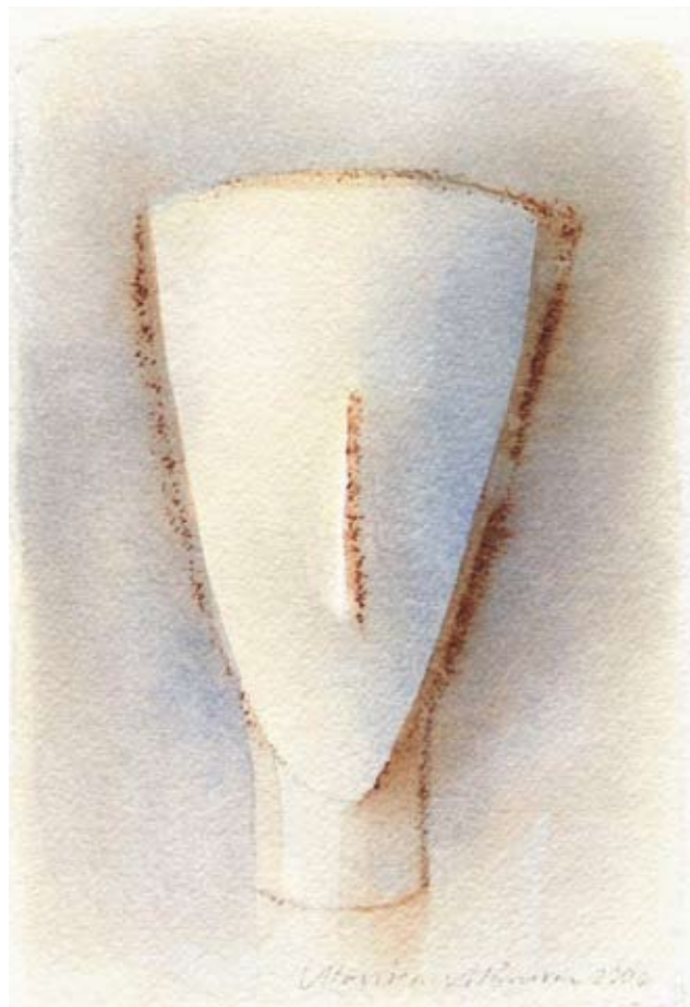
Ansikte, 22x15 cm, 2006

I de här nyare målningarna är färgerna ibland kraftfullare och mera kontrastrika än i de skålar och ansikten jag ser hos henne. Jo visst kan hon gå upp i framför allt blått, hon använder gärna ultramarin (French Ultramarine). Och då dämpar hon helst den kraftiga valören med att lägga en glasskiva över akvarellen, för att den inte ska skrika för mycket.